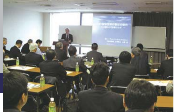
技術セミナー風景