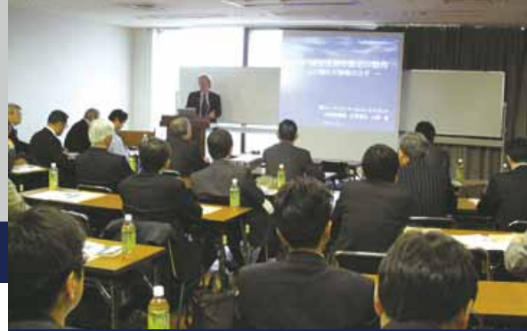
技術セミナー風景